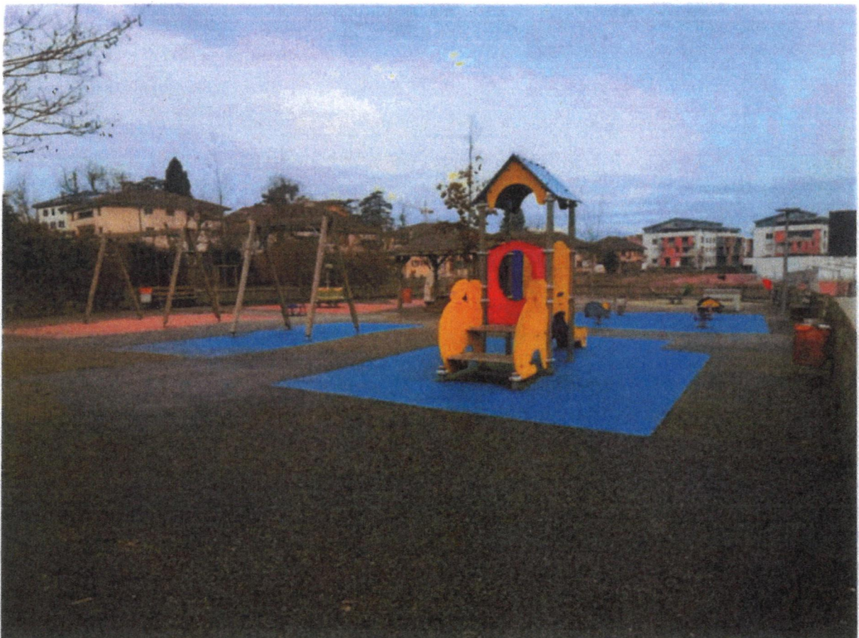
Le revêtement absorbe la chaleur et représente un risque en cas de chute.