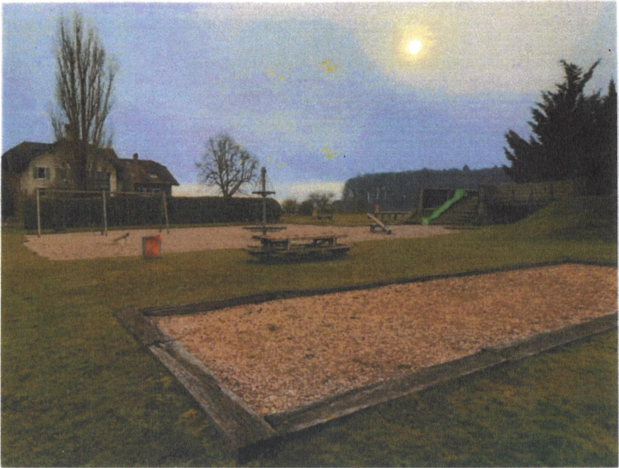
La place de jeu de Dizy fait la part belle au gazon et au gravier