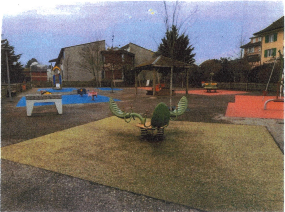
La place de jeu du Prés-aux-Moines à Cossonay est majoritairement minérale.