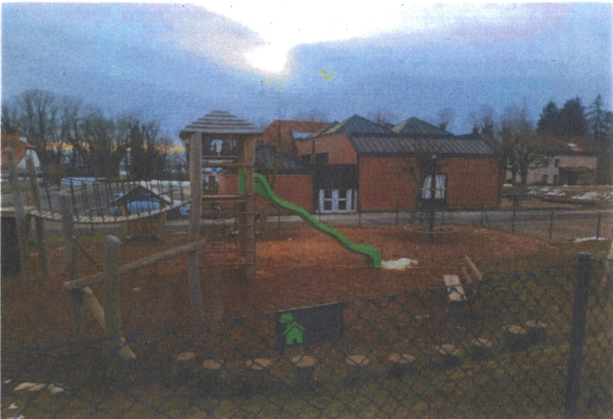
A L'Isle, les enfants peuvent jouer dans les copeaux ce qui limite les risques de se faire mal en cas de chute.