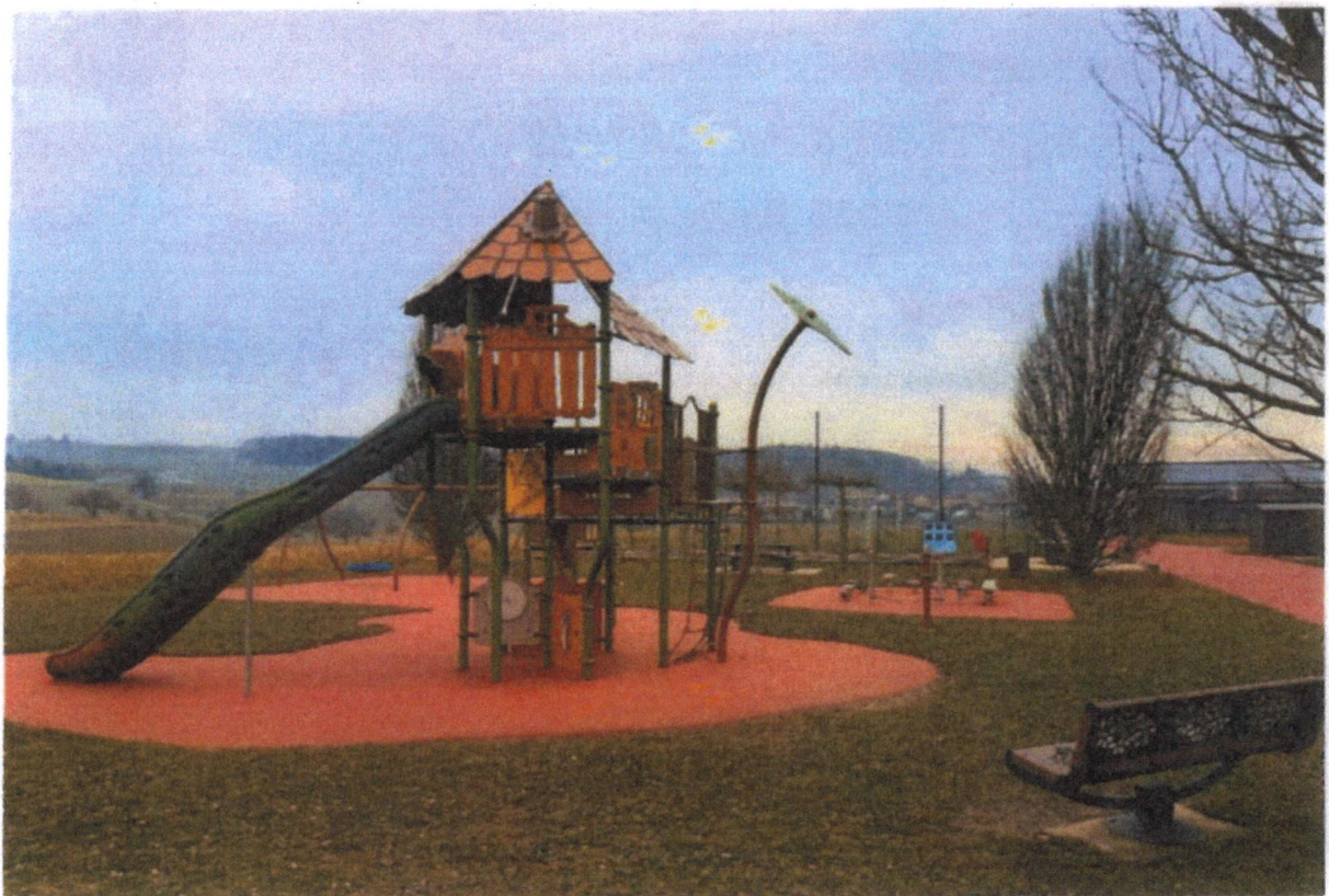
Le mobilier de la place de jeu de Vufflens-la-Ville est nettement plus élaboré qu'à Cossonay