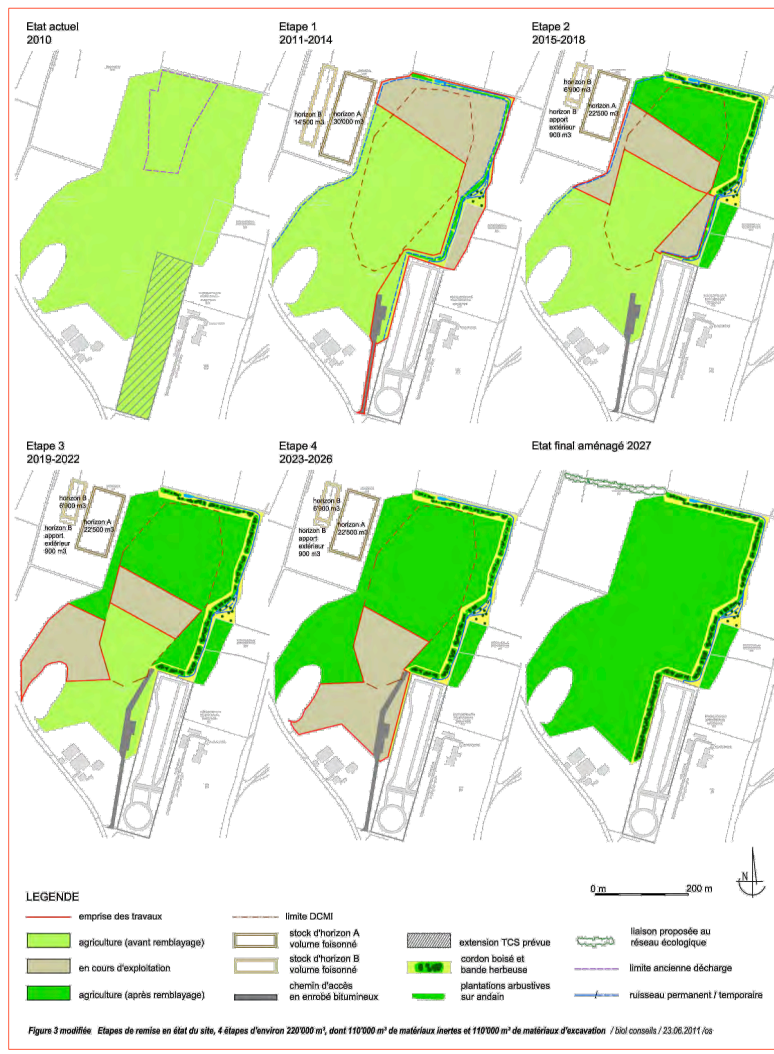
Figure 3 modifiée: Etapes de remise en état du site, 4 étapes d'environ 220'000 m 2 , dont 110'000 m 2 de matériaux inertes et 110'000 m 2 de matériaux d'excavation / bit consult / 23.06.2011 (a)