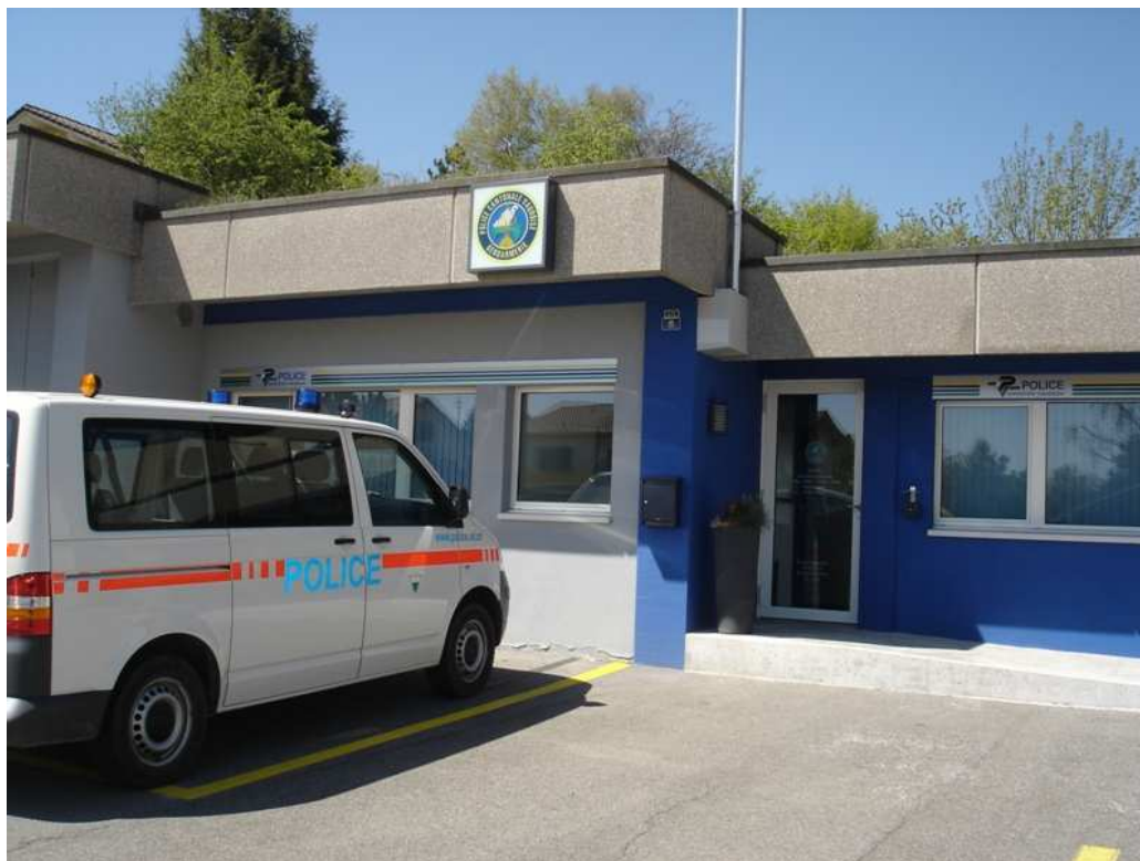
Nouveau poste de gendarmerie, inauguré le 10 novembre 2009