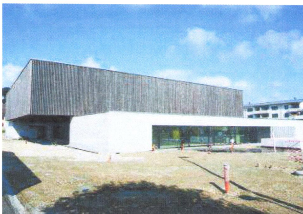
Début septembre, les travaux d'aménagements extérieurs se déroulaient dans de bonnes conditions.

Dans le courant de la journée du 10 octobre, les autorités communales présenteront la salle à