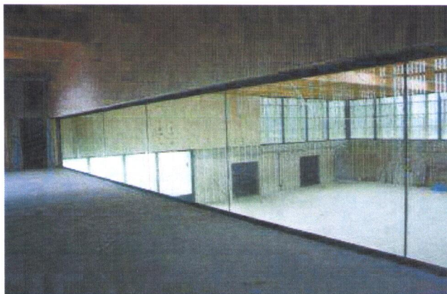
Coup d'œil depuis la salle de rythmique, du 1 er étage.