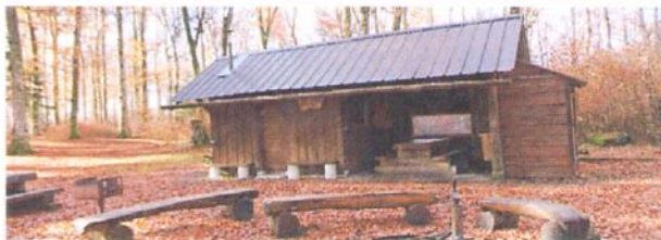
L'Espace Landry, la cabane des Bûcherons et le chalet du Jura-Club.