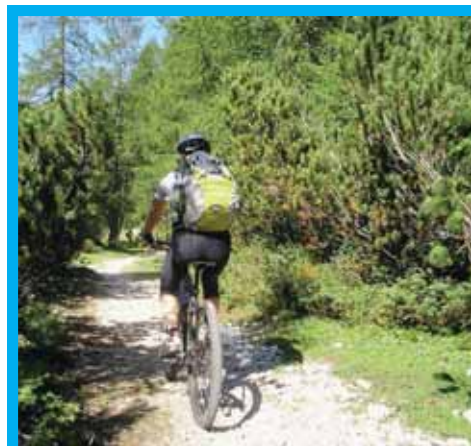
Pratique du VTT en forêt

ment un nouveau site web et son pendant mobile pour tablettes et smartphones. Afin que ces nouvelles interfaces soient également accessibles aux seniors de la région, les MBC organisent des ateliers gratuits à leur attention, en collaboration avec Pro Senectute. Informations et inscriptions au 021 811 43 45 ou via vente@mbc.ch .