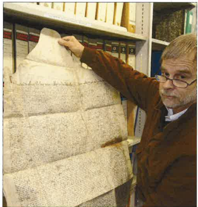
Prudence en les consultant, ces parchemins sont délicats.