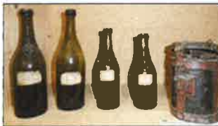
Pots «fédéral et vaudois» accompagnant une croustille «de sorte».

Cinq parchemins ont été retrouvés en 2001 dans le coq du clocher de l'Eglise, au moment de la réfection de ce dernier. Deux remontaient à l'an 1469, un autre était de 1645, et les deux derniers dataient de 1709 et 1733. Retrouvés enroulés, secs et cassants, ils ont été restaurés par une entreprise spécialisée de Bellinzone. Puis ils ont été déchiffrés et traduits par un collaborateur