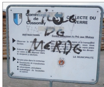
Panneau officiel «joliment annoté»!

À mon avis, il s'agit de quelqu'un de mal dans sa peau ou d'un individu fâché de s'être fait amender pour un mauvais parcage! relève-t-il. Et de citer quelques exemples vécus concrètement ces derniers mois. Le taggeur devrait venir nous le dire franchement. Je le recevrais volontiers pour en discuter calmement et le convaincre facilement que ces propos ne tiennent pas la route! conclut le syndic dans un grand sourire ■