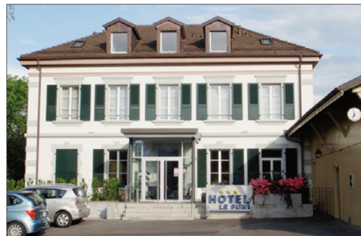
Hôtel «Le Funi».