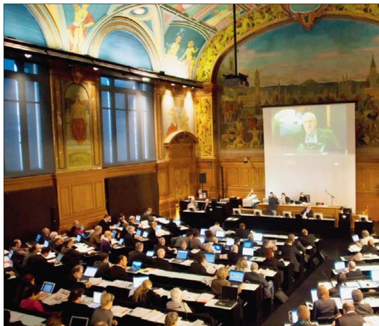
Salle du Grand Conseil.

Son accent neuchâtelois ne laisse aucun doute sur ses origines! En effet, je suis née au Val de Ruz et j'ai effectué ma scolarité et mon gymnase au Locle. Toute jeune, elle imaginait devenir trapéziste volante dans un cirque! Paradoxal, car je n'étais absolument pas à l'aise en gymnastique, je souffrais de vertige, j'étais très timide et, dans mes rêves d'enfance, c'était l'évasion ultime! avoue-t-elle dans un éclat de rire. Adolescente, elle s'est ensuite intéressée aux professions d'enseignante et d'infirmière, avant de poursuivre ses études à l'Université de Neuchâtel où elle a obtenu une licence en sciences sociales.