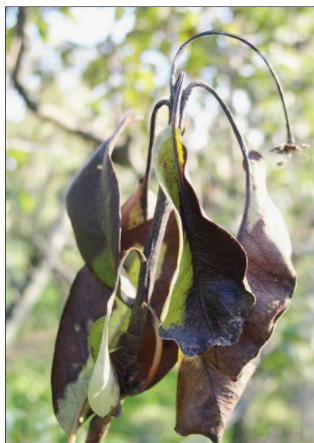
Feuilles «brûlées» en forme de crosse.

Noircissement et dessèchement sur place des bouquets floraux ou des pousses tendres qui se recourbent en croses caractéristiques sont les symptômes typiques du feu bactérien. Les feuilles des parties atteintes