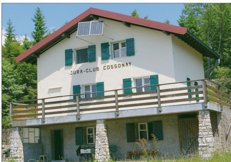
Le chalet du Jura Club, dans son cadre de nature.

En 1957, le souhait de construire est repris. Des pourparlers commencent avec le chef du service cantonal des forêts qui accepte de louer un terrain au groupe des skieurs, prélevé sur la parcelle n° 10 de Mont-la-Ville, dans la forêt cantonale de Pétra Félix, à l'altitude de 1338 m. Une commission de construction est nommée l'année suivante, des souscriptions sont lancées et les travaux débutent en 1959. Cette même année, le groupe des skieurs quitte la société de gymnastique et se constitue en société autonome, sous le nom de «Jura-Club de Cossonay».