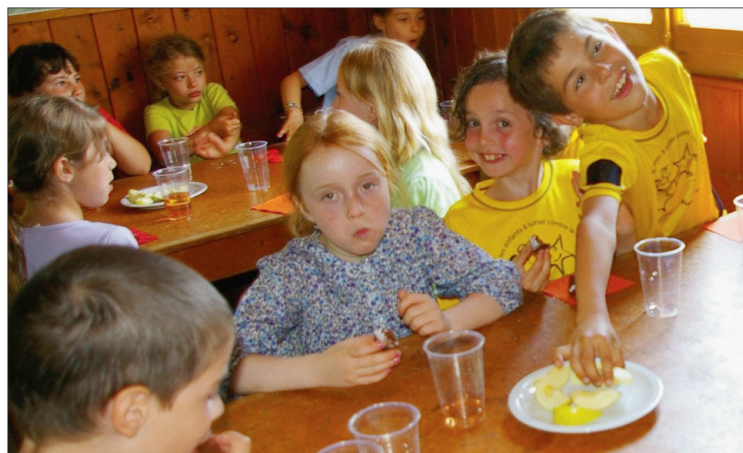
Une autre manière de faire l'école!