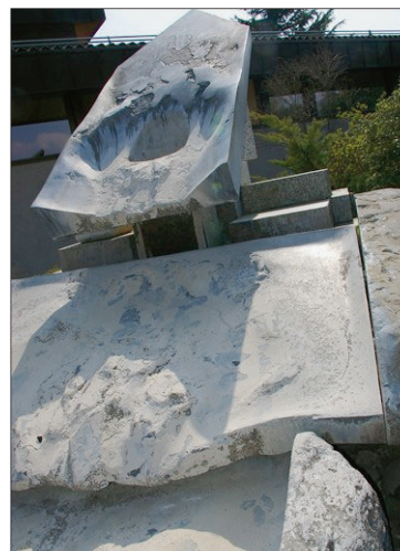
La fontaine du PAM est «à sec».

losophe. C'est d'ailleurs un élément toujours utilisé comme tel dans certains parcs et jardins et en ville. Enfin, la fréquence du mot «fontaine» dans les noms de ville et lieux-dits montre l'importance de l'accès à l'eau dans l'histoire humaine.