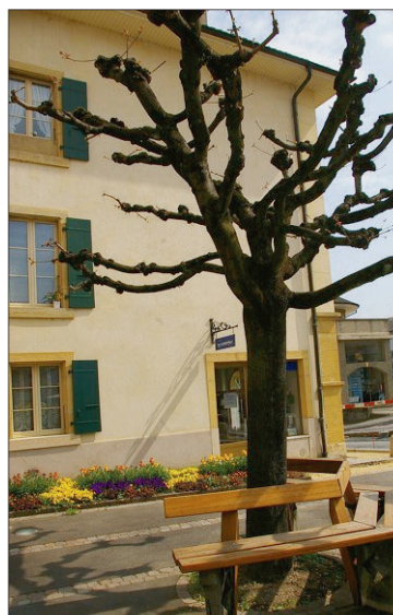
Banc «multi angle de vision».

«Esseulés dans les parcs et à la lisière des forêts, les bancs publics bravent les saisons. Ils attendent avril et ses passants qui, entre les «gling gling» des sonnettes de vélos, posent leurs fesses sur le bois peint. Parfois en vert, parfois en brun!» C'est ce que proclame un extrait de