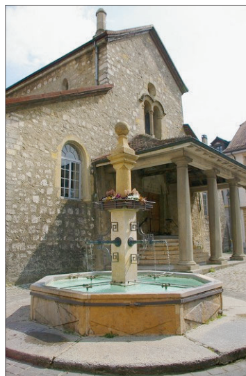
La fontaine à 8 pans de la Place de l'Eglise.