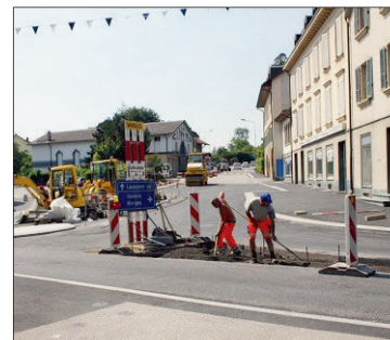
Les travaux du Carrefour du Pont devraient être achevés le 9 juillet prochain. JLG

Dès le lundi 12 juillet, la nouvelle signalisation sera en place. Durant cette phase des travaux, le trafic de Cossonay en direction de la Sarraz sera donc dévié par La Chaux. Par