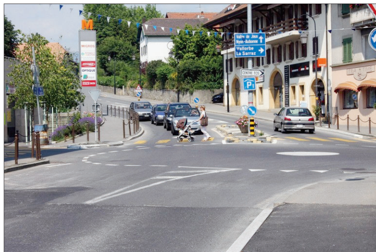
Le carrefour de la Poste qui sera en chantier dès le 12 juillet avec (à droite) la fermeture de la Grand-Rue jusqu'au 20 août.

La Municipalité tient à remercier vivement la population pour sa compréhension durant cette période des travaux. ■