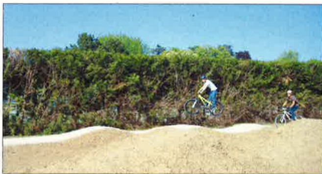
Piste bicross pour le Vélosprint: uniquement de l'entraînement.

D'autre part, la section vaudoise du TCS souhaite organiser des cours de formation «terrain» pour motards dans le but d'apprendre aux