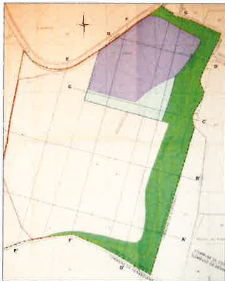
En «bleu foncé»: zone motocros, en bleu clair: aire bicross, en vert: surface naturelle.

Le mandant du projet de pistes de motocross et de vélo bicross est la commune de La Chaux, soutenue par la Municipalité de Cossonay. Le man-