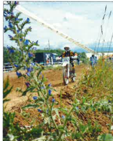
Lors d'un motocross Angora à La Chaux.

Il en ressort donc que les projets de gravière, de DMEX, de motocross, de vélo bicross et les cours du TCS sont conformes avec l'aménagement du territoire et compatibles avec toutes les contraintes liées à la protection de l'environnement. ■