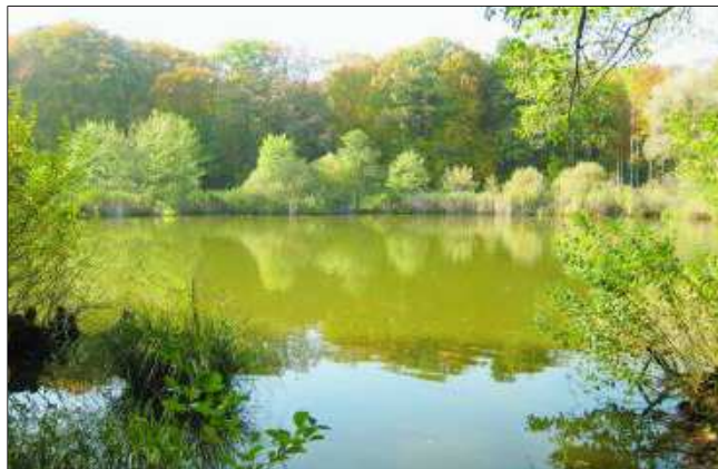
L'Étang du Sépey attire bon nombre de promeneurs.