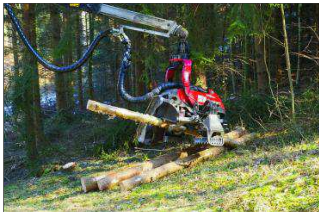
Abattage mécanique: rapide, efficace, propre et... impressionnant!

elle s'accroît de 708,4 m 3 par an, ou encore 0,08 m 3 par heure! Harry Kleiner souhaite enfin que la cohabitation actuelle entre les utilisateurs et acteurs de la forêt puisse perdurer et qu'on ne débouche pas sur cette ambiance tendue ressentie en milieu urbain. ■