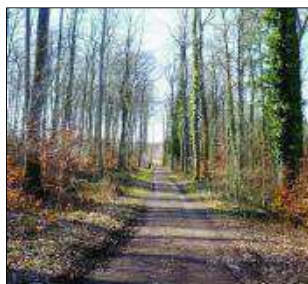
Des chemins forestiers «impeccables».

Ces quelques lignes font plaisir et elles soulignent la qualité du travail des collaborateurs du service travaux/voirie de Cossonay. Qu'ils en soient remerciés!