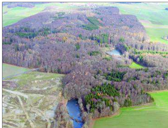
Vue aérienne de la Forêt du Sépey.